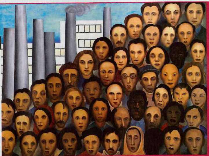
AGENCIAMENTO ARTISTICO-CULTURAL DOS PALACIOS

EXPO PASS: 30 €/pers. pour visiter les 4 expositions majeures de la manifestation: Brazil.Brasil; Terra Brasilis; Art in Brazil; Indios no Brasil.