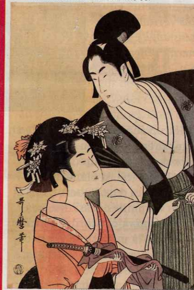
© MUSEUM OF ASIAN ART CORFOU, GREECE. PHOTOGRAPHY BY NEW COLOR PHOTOGRAPHIC PRINTING CO.

La Fondation Beyeler consacre son exposition d'automne au Surréalisme à Paris. Parmi les peintures issues du monde entier, le musée présente les collections privées surréalistes de Peggy Guggenheim et Simone Collinet, la première femme d'André Breton. Respect! Et prend également en compte d'autres formes artistiques telles que le collage, la photographie et le cinéma (2 octobre 2011-29 janvier 2012. 77, Baselstrasse. Riehen/Basel. 00-41-61/645.97.00. www.fondationbeyeler.ch) - Photo: Salvador Dalí, Rêve causé par le vol d'une abeille autour d'une pomme grenade une seconde avant l'éveil, 1944. Musée Thyssen-Bornemisza, Madrid.