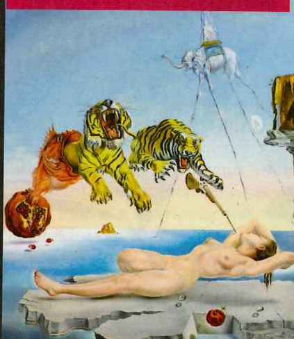
© SALVADOR DALÍ, GALIA-SALVADOR DALÍ FOUNDATION/2011, PRO-UTTERS, ZÜRICH.

Dans les années 1900, la vogue du japonisme s'empare de l'Europe. Gregorios Manos réunit alors des pièces rares: bronzes, gardes de sabre (tsuba), armes, céramiques... et plus de 1500 estampes. L'équivalente à l'État grec, la Collection Manos se découvre au Musée national d'art asiatique de Corfou. Du 28 septembre au 17 décembre, elle se transporte partiellement à la Maison de la culture japonaise de Paris, le musée prêtant 150 estampes signées par 8 maîtres de l'ukiyo-e. Issu d'un mot signifiant «image du monde flottant», ce mouvement de l'époque Edo (1603-1868) se caractérisait par une peinture populaire et des estampes gravées sur bois (101bis, quai Branly. 75015 Paris. 00-33-1/44.37.95.00. www.mcjp.fr) - Photo: Kitagawa Utamaro, Jeune samouraï et jeune femme.